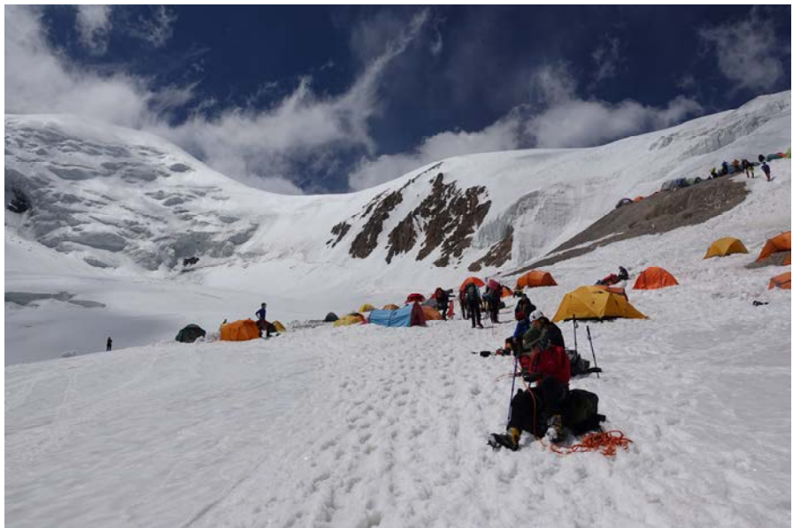
(pirmas poilsis C2)