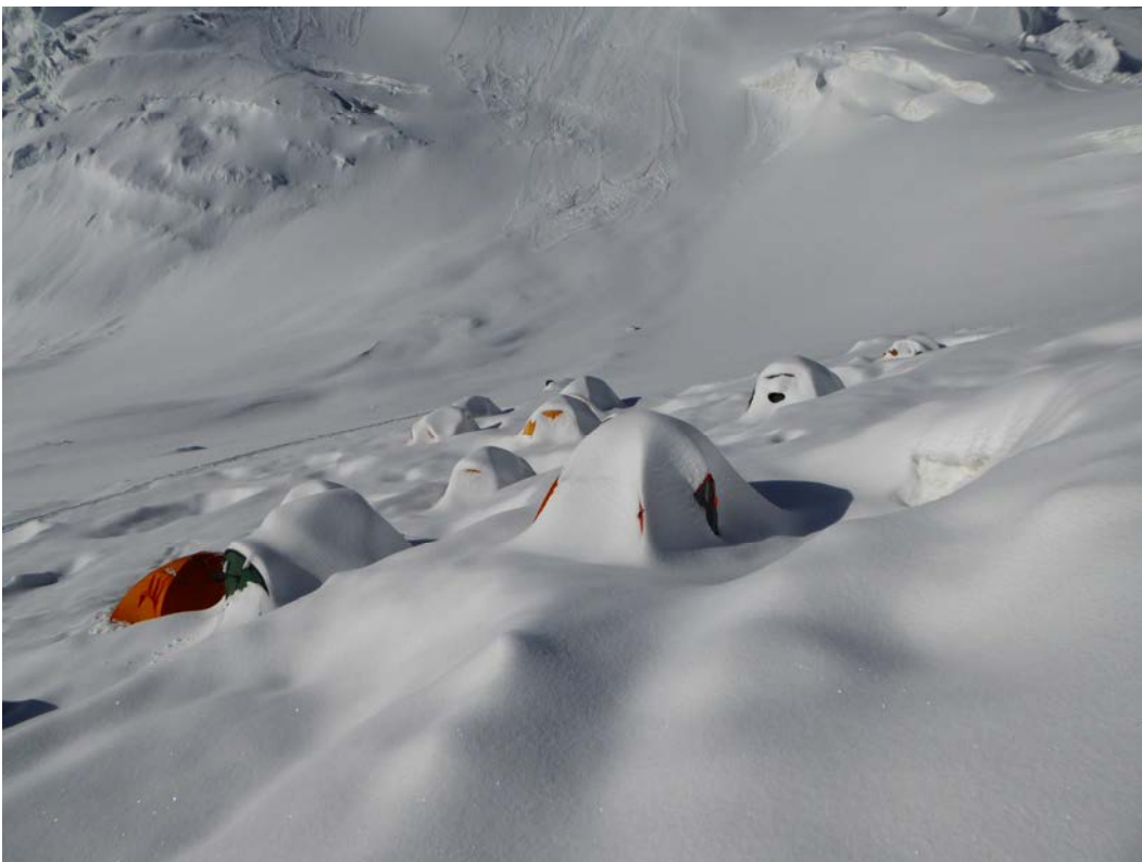
(C2 po nakties)