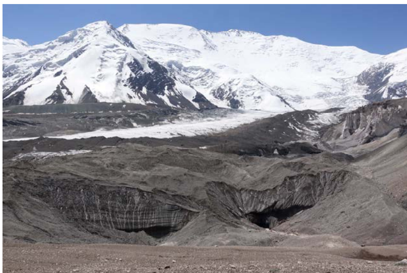
7/25 – poilsis ABC. Aklimatizacinis žygis į Juchin viršūnę (5122m.). Oro sąlygos puikios