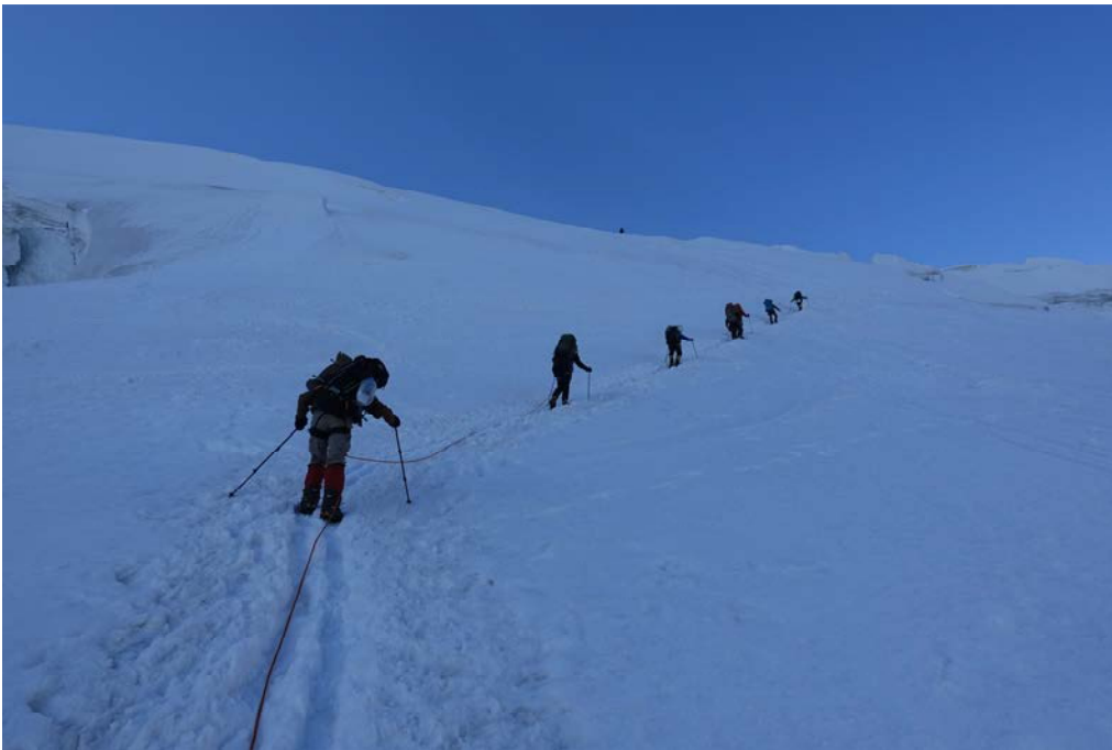
(iš C1 i C2)