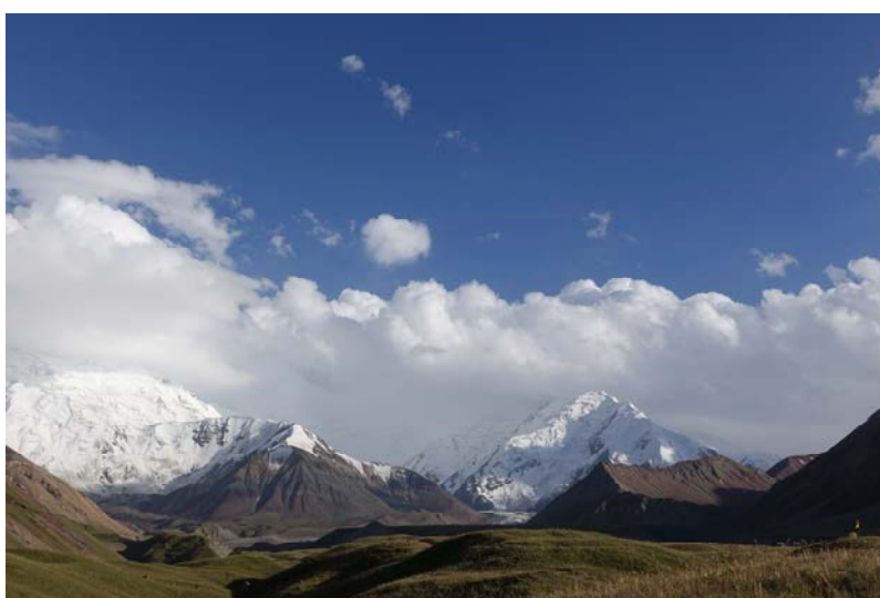
7/24 – BC-ABC. Oro sąlygos puikios