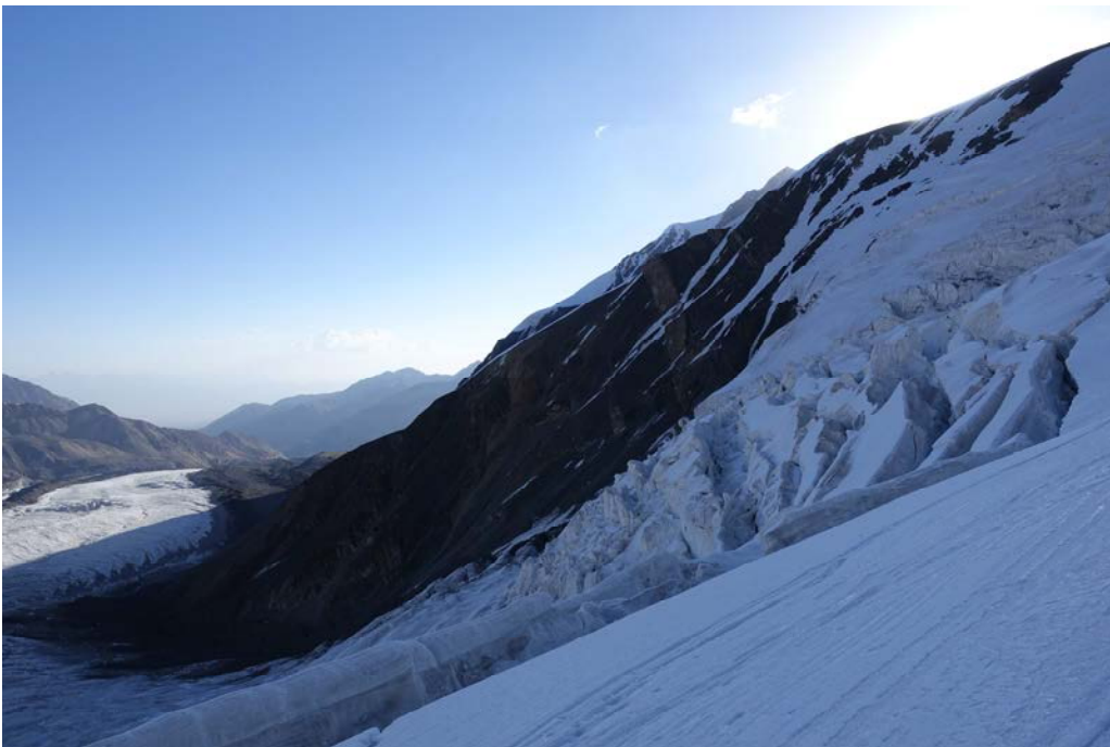
(iš C1 i C2)