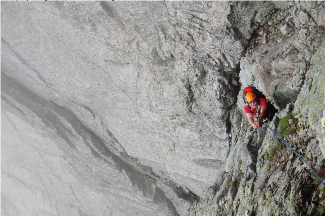
Nuotrauka su dalyviais ant viršūnės arba maršruto pabaigoje