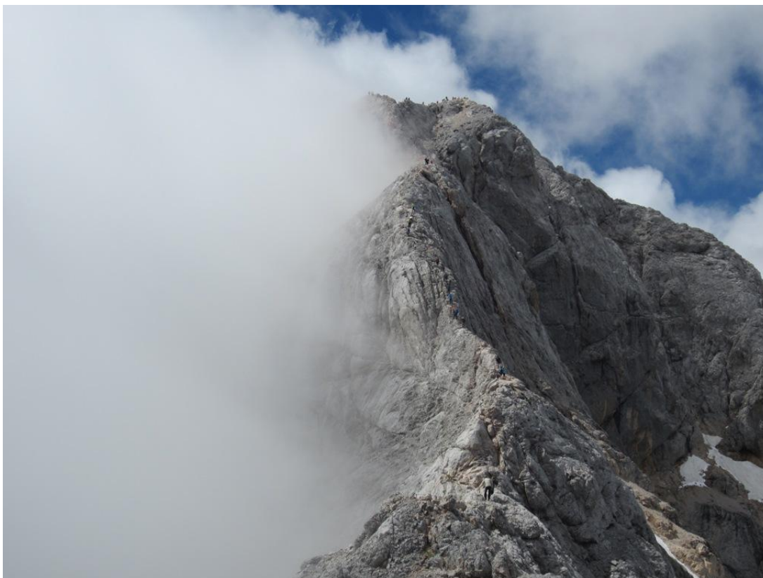
Siaura ketera jungianti Mali Triglav 2725 m. ir Triglav 2864 m. (foto 5-6)