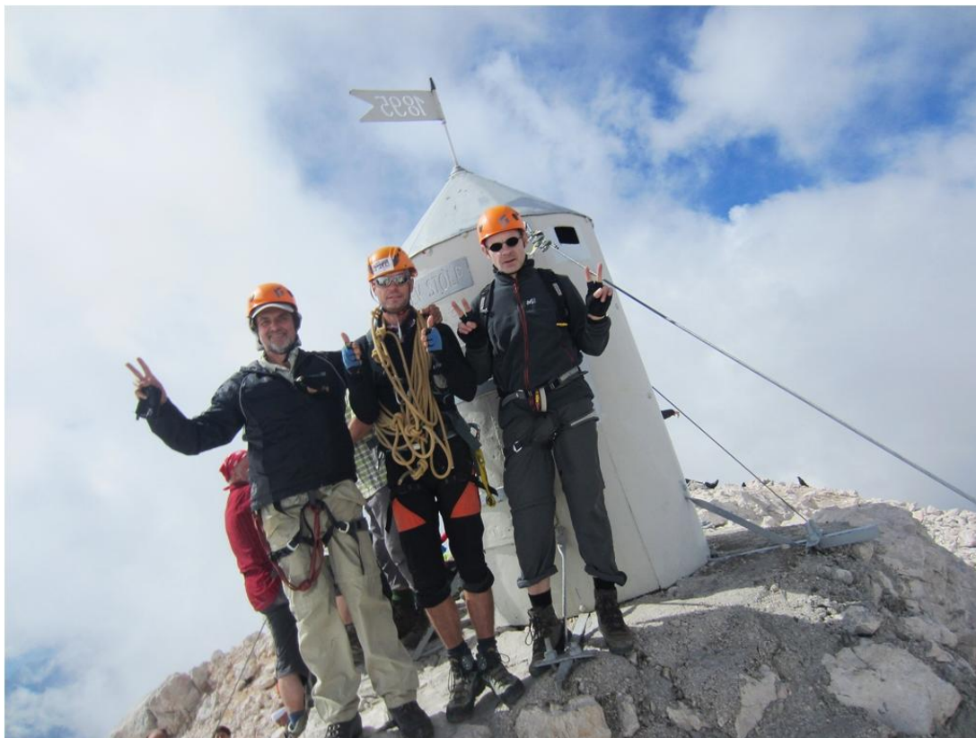
Triglavo 2919 m viršūnėje. 2016 m. rugpjūčio 13 dieną (foto 7-8)