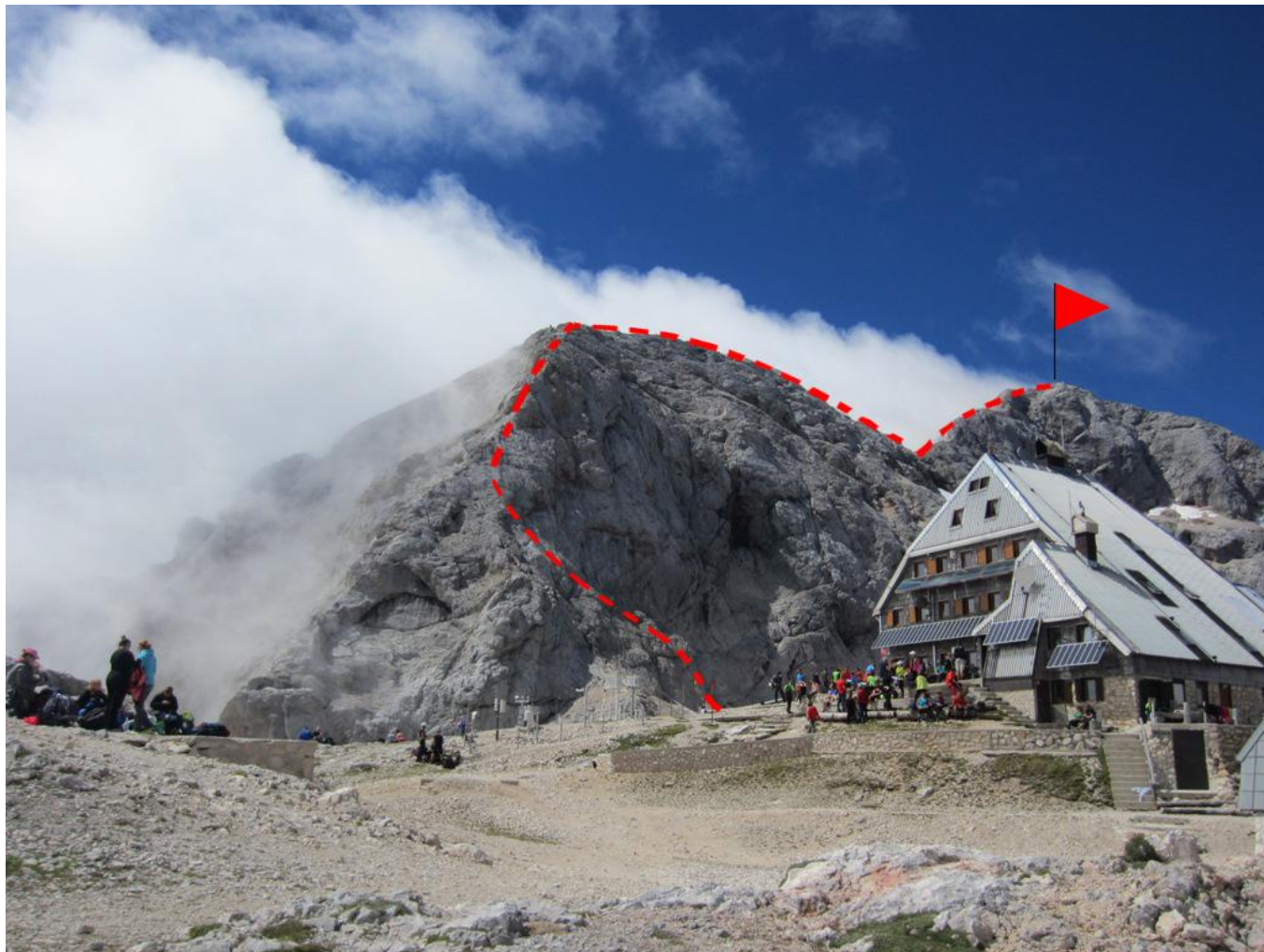
Triglavskij Dom na Kredarici 2515 m. Maršrutas pažymėtas raudonai. (foto 3-4)