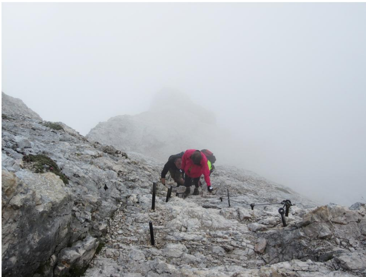
Stati, vietomis beveik vertikali maršruto pradžia kopiant į Mali Triglav 2725 m. Pagelbėja stacionarūs turėklai.

Techniškai sudėtingų atkarpų nuotraukos Pateikti bent kelias nuotraukas!