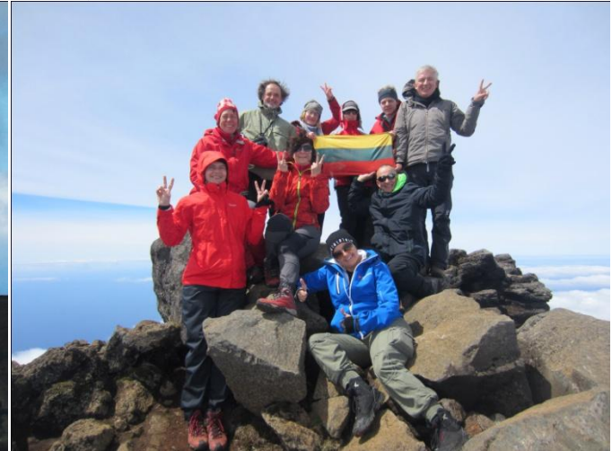
Pico 2351 m (Azorų salos) (foto 11-12)