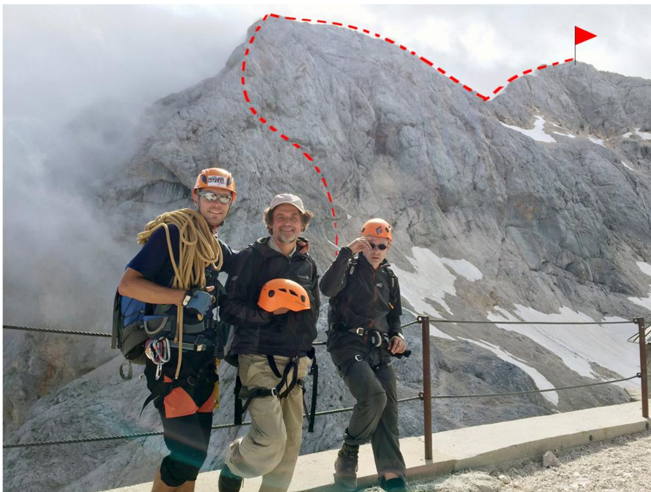
po įkopimo ant Triglavskij Dom na Kredarici 2515 m terasos. Už mūsų Mali Triglav 2725 m ir Triglav 2864 m