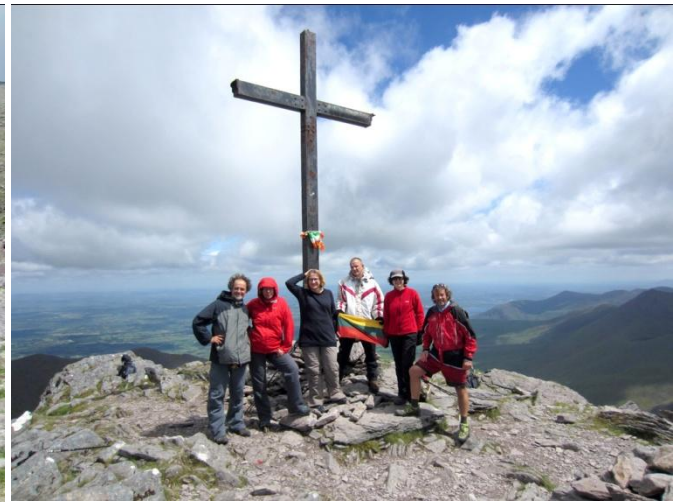
Carrauntoohil 1038 m. (Airija) ( foto 14-15)