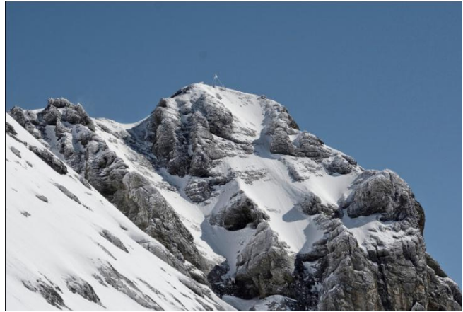
Titlis 3238 m. (Šveicarijos Alpės) (foto 9-10)