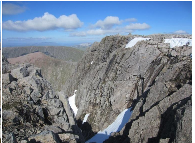
Ben Nevis 1344 m (Škotija) (foto 13)