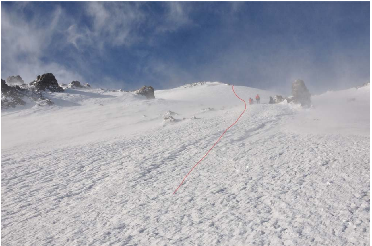
7 pav. Kelias iš Lenco uolų viršaus (5300 m.) link Elbruso rytinės viršūnės