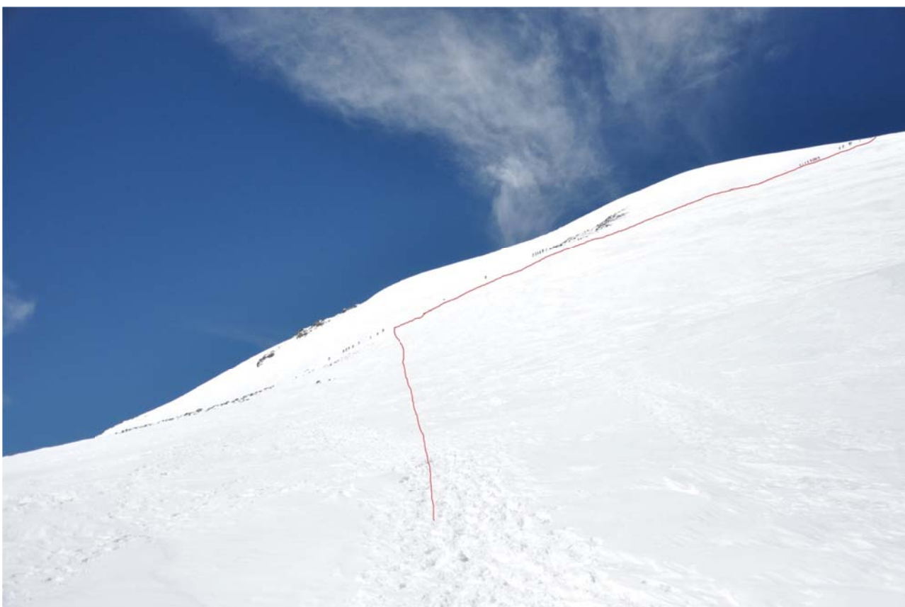
4 pav. Kelias iš balno (5370 m.) link vakarinės Elbruso viršūnės (stačiausia atkarpa maršrute)