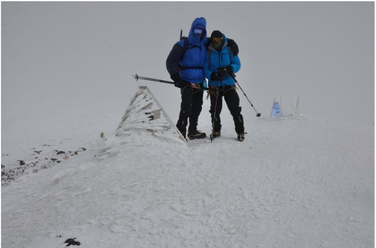
8 pav. Elbruso rytinė viršūnė