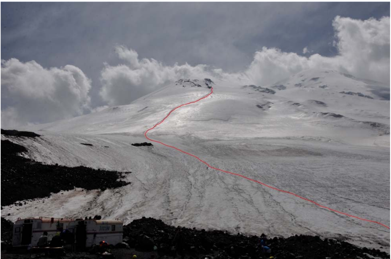
2 pav. Kelias iš aukštuminės stovyklos (3720 m.) iki Lenco uolų apačios (4600 m.)