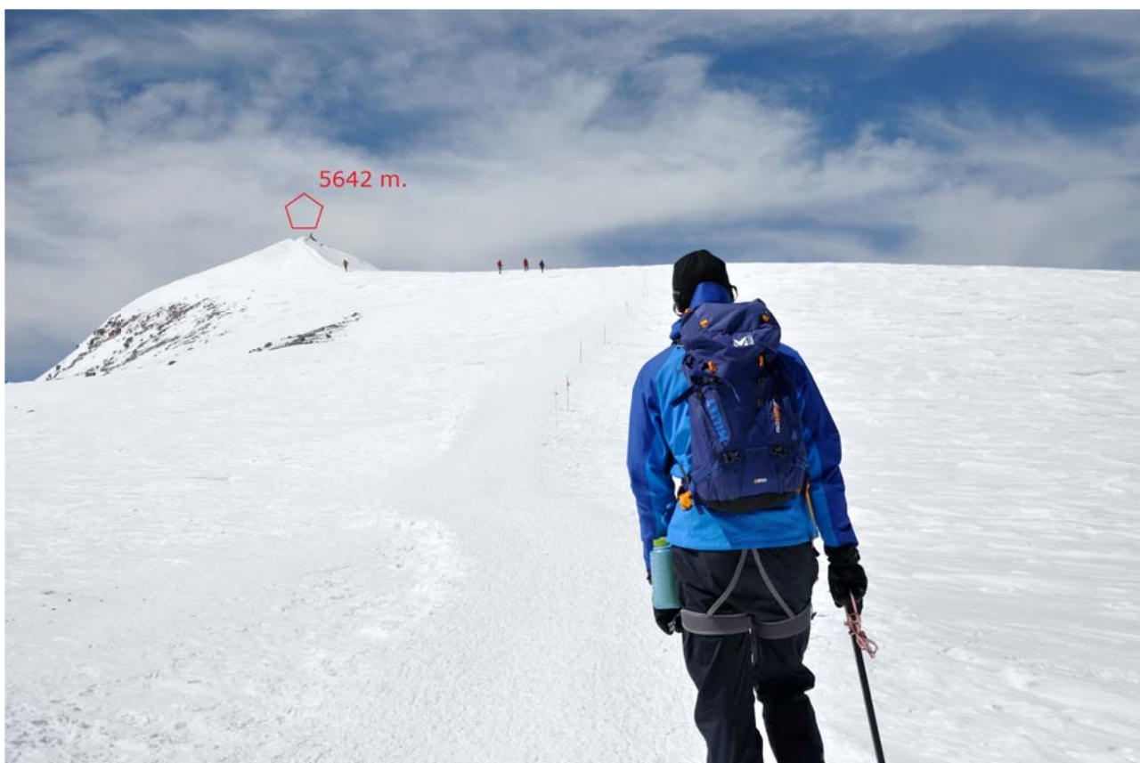
5 pav. Paskutinė atkarpa link vakarinės Elbruso viršūnės