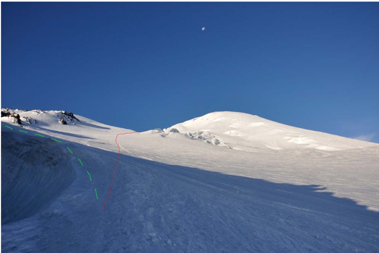
3 pav. Raudona linija - kelias iš Lenco uolų apačios (4600 m.) link balno (5370 m.) kylant į vakarinę viršūnę. Žalia punktyrinė linija – kelias į rytinę viršūnę.