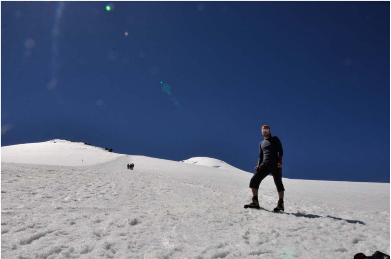
1 pav. Aklimatizacinis pasivaikščiavimas iki 4200 m.