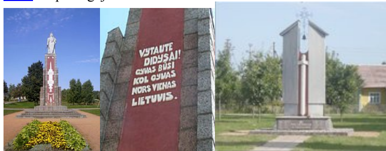
Paminklas Vytautui Didžiajam Paminklas žuvusiems partizanams atminti

1863 m. sukilimo metu sugriautas Lietuvos didžiojo kunigaikščio dvaras, kuriame veikė geležies dirbtuvės gaminusios geležį iš balų rūdos ir davusios tada dar bevardžiui intakui Amarnios vardą (nuo vokiško žodžio hammer – „kūjis“). Po sukilimo buvo uždaryta dar Vytauto Didžiojo laikais pastatyta maumedinė Perlojos bažnyčia ; ji vėl pradėjo veikti tik 1905 m. pabaigoje.