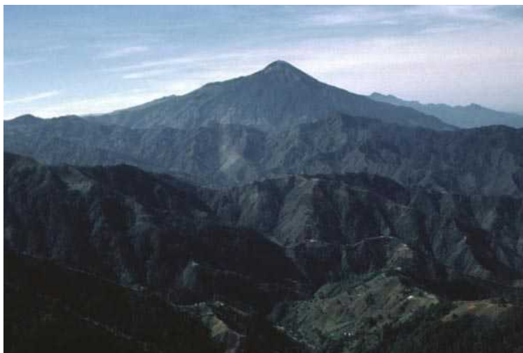
Tajumulco (4220 m)

El. paštas: bukauskasv@yahoo.com Mob. tel. 8-687-33303