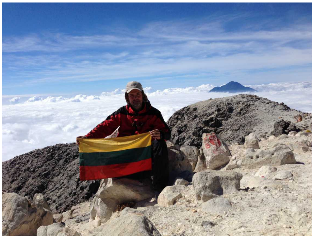
Pirmoji lietuvių grupė ir pirmą kartą Lietuvos vėliava