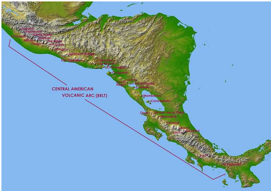
Tajumulco ugnikalnis yra Centrinės Amerikos vulkaniniame lanke