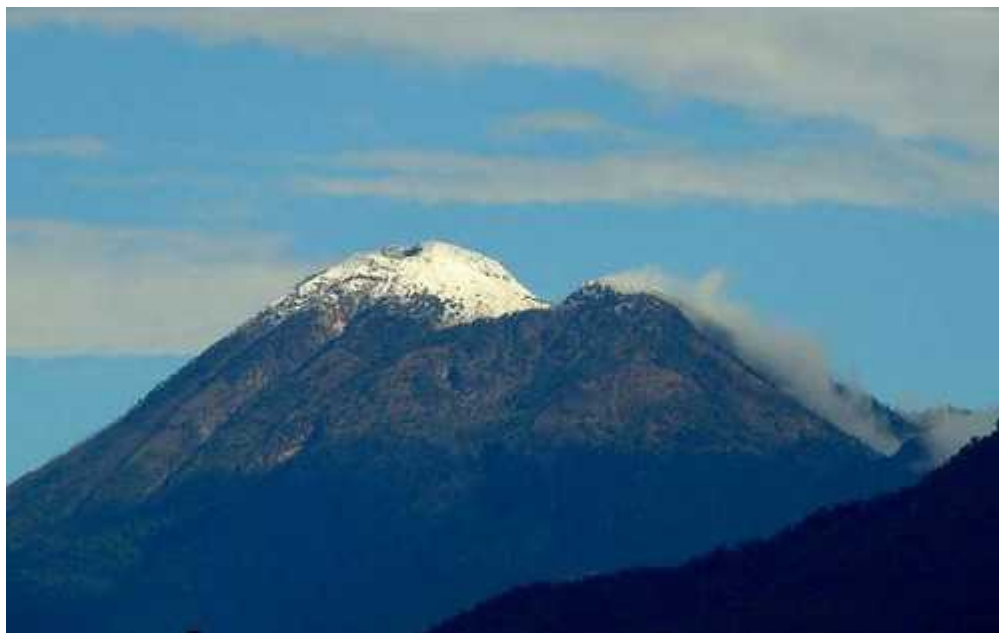
Tajumulco (4220 m) aukščiausia Gvatemalos ir Centrinės Amerikos viršukalnė