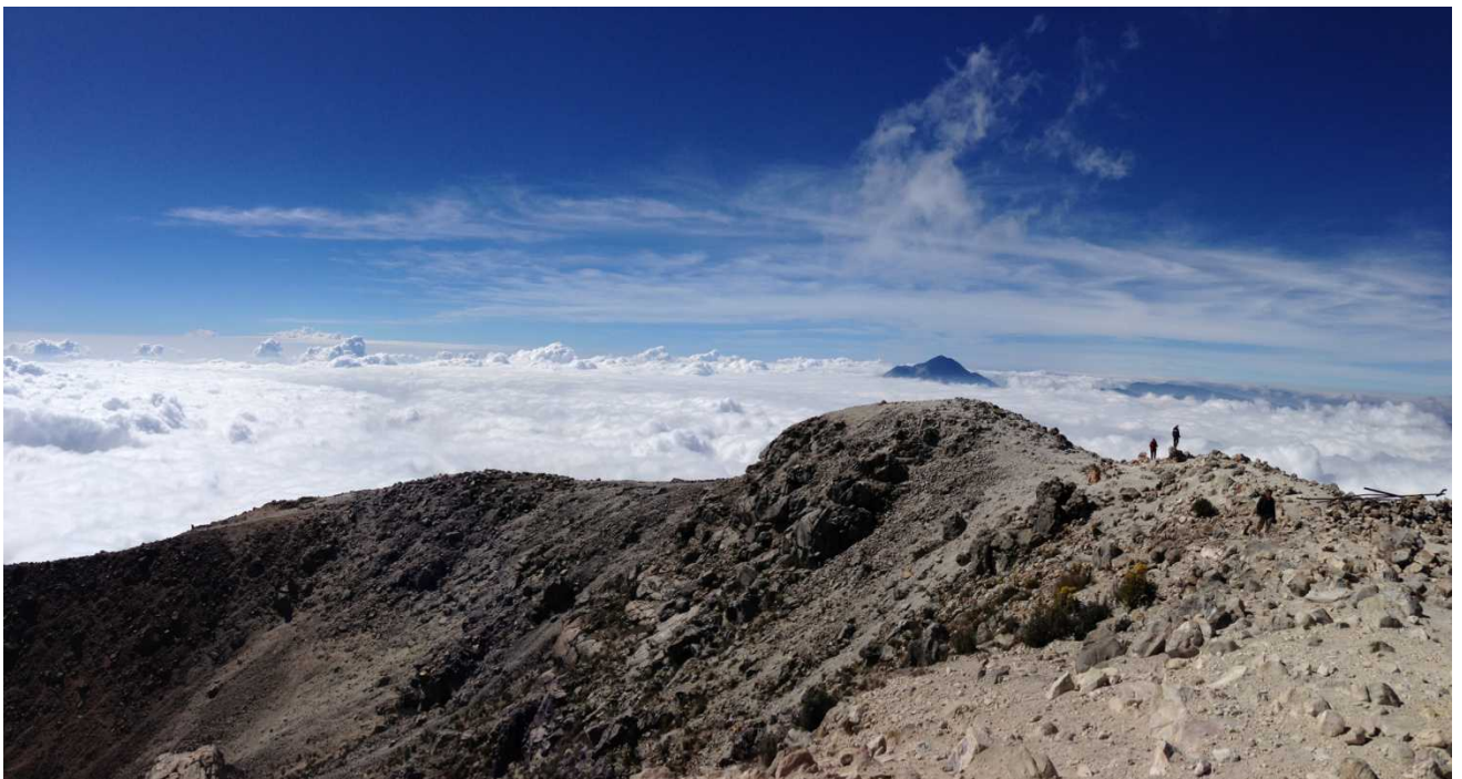
Paskutinį kartą ugnikalnis buvo įsiveržęs 2008 gruodžio 20 d.