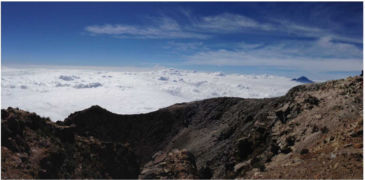
2012 lapkričio 19 d.