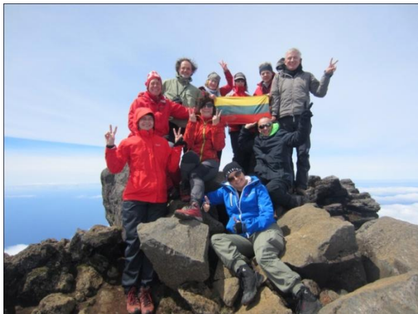
Pico 2351 m (Azorų salos) (foto 16-19)