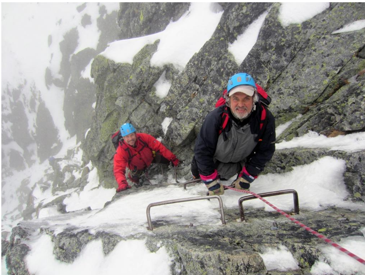
Antra uolų pakopa Balizovska proba : vietomis vertikalu, apledėjusios uolos po sniegu, kai kur apsnigtos skabės ir saugos taškai, visą laiką reikia eiti su „katėmis“ (foto 10)