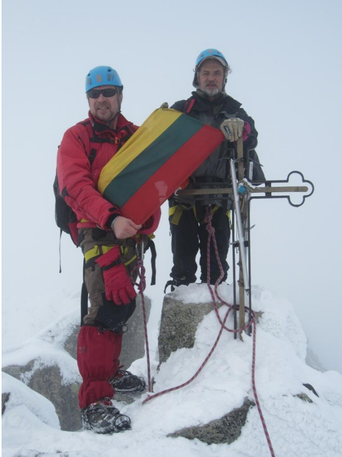
Viršūnėje yra kryžius ir lentelė – dėžė. (foto 14-15)