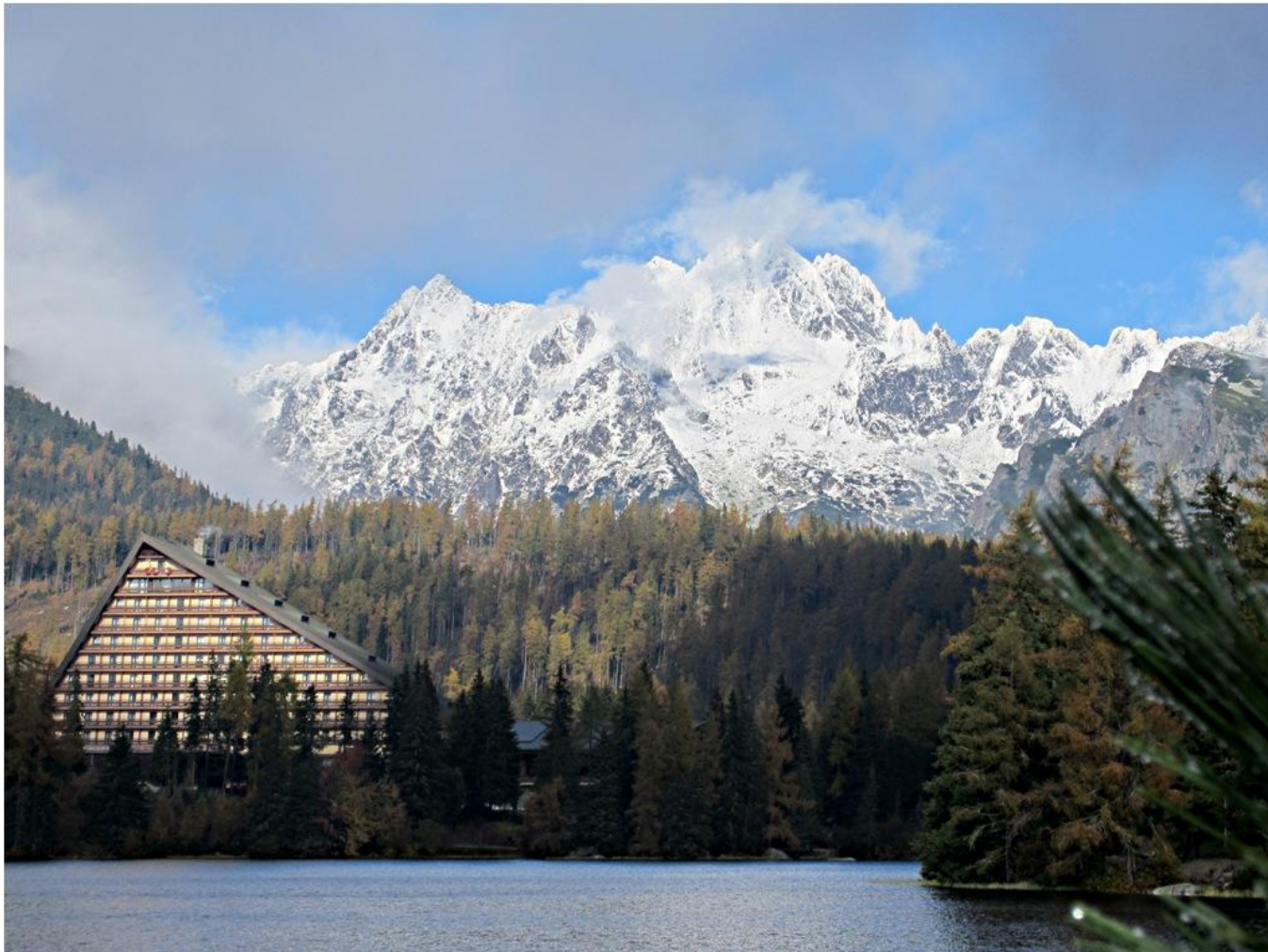
Aukštieji Tatrai savo panorama primena Alpes (foto 33)

Pagal turimą informaciją pirmasis žiemą 2008 m įkopė Saulius Damulevičius .