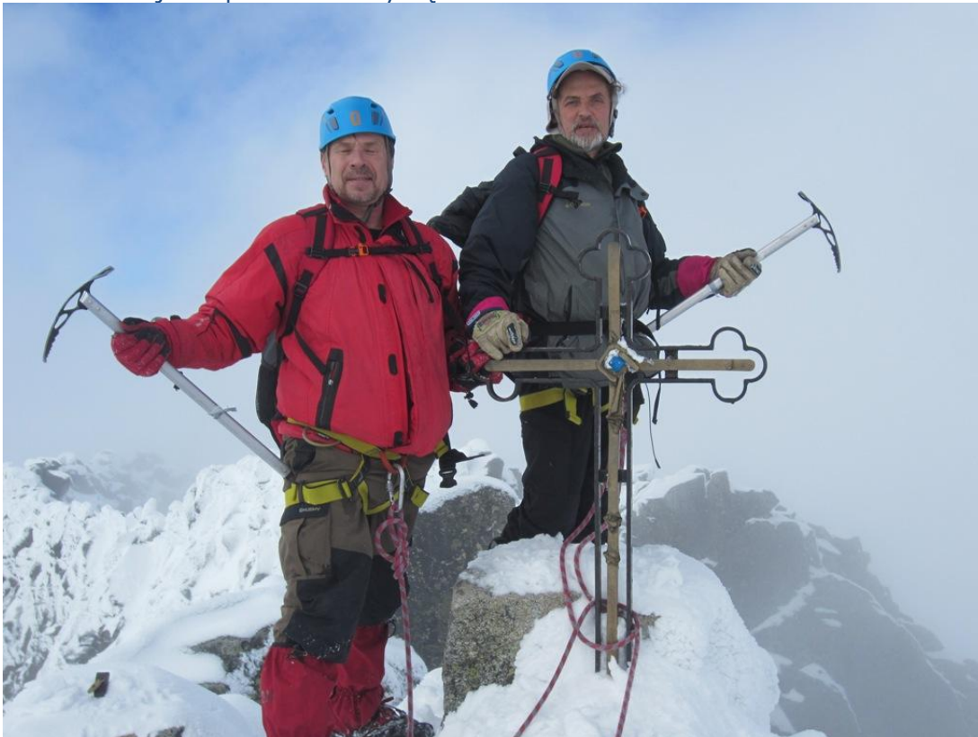
Lietuvos trispalvė Gerlachovský štít 2655 m viršūnėje. 2016 m. spalio 23 dieną, 13:00. (foto 13)

Rekomenduojama pateikti ir dalyvių nuotraukas!