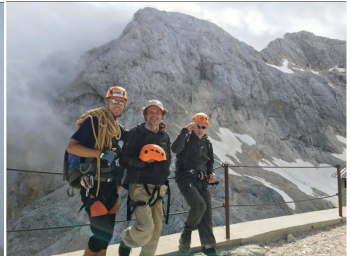
Triglavas 2864 m (Slovenijos) (foto 27-30)