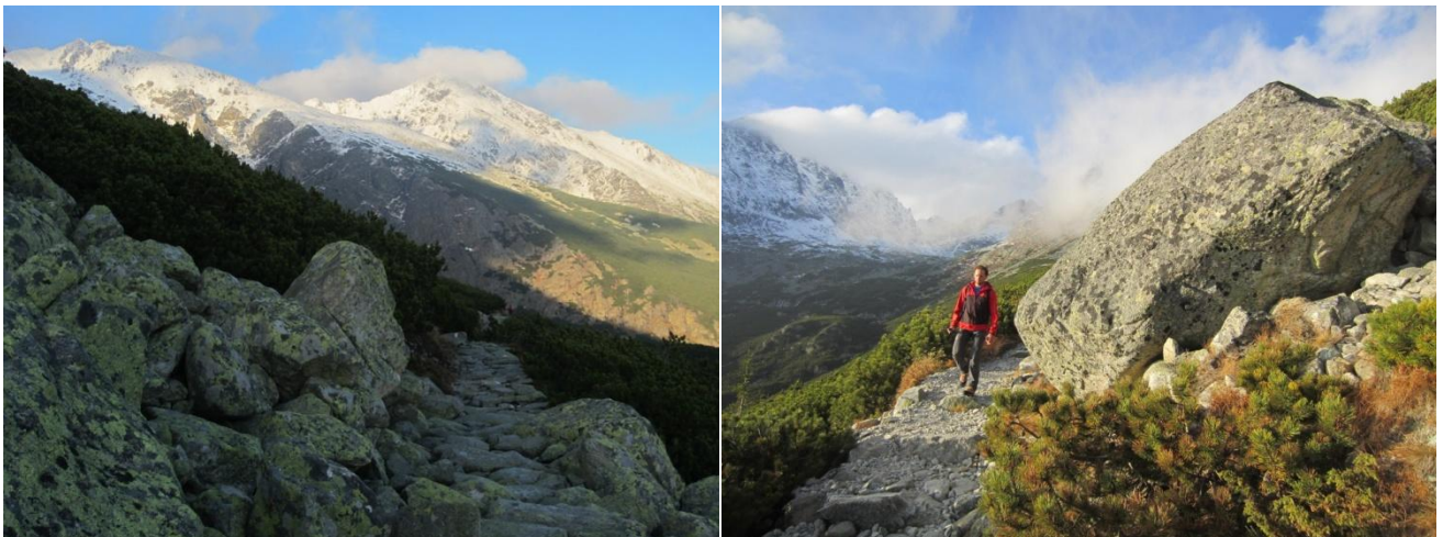
Magistrala Tatrzańska (foto 2a-2b)

Aukštieji Tatrai (slovakiskai „Vysoké Tatry“, lenkiškai „Tatry Wysokie“) yra aukščiausia Karpatų kalnų dalis, priklausanti Slovakijai (4/5) ir Lenkijai (1/5). Rytuose kalnai pereina į Belianskio Tatrus, vakaruose į Zapadne Tatrus. Aukštieji Tatrai dėl savo kompaktiškumo kartais vadinami mažiausiu kalnynu pasaulyje, nors faktiškai tėra tik Karpatų kalnyno 1300 km dalis. Pagrindinė Aukštųjų Tatrų kalnų grandinė yra vos 27 km ilgio. Bendras Aukštųjų Tatrų masyvo ilgis iš vakarų į rytus yra apie 65 km. Miškinga zona baigiasi maždaug 1500 m aukštyje. Virš 15 viršūnių yra aukštesnės nei 2500 m. Aukščiausios Aukštųjų Tatrų (o tuo pačiu ir visų Tatrų) viršūnės: Gerlacho viršūnė ( Gerlachovský štít – 2655 m, tuo pačiu aukščiausias Slovakijos kalnas), Lomnicki Štítas (2632 m), Ladovi Štítas (2627 m), Pyšni Štítas (2623 m).