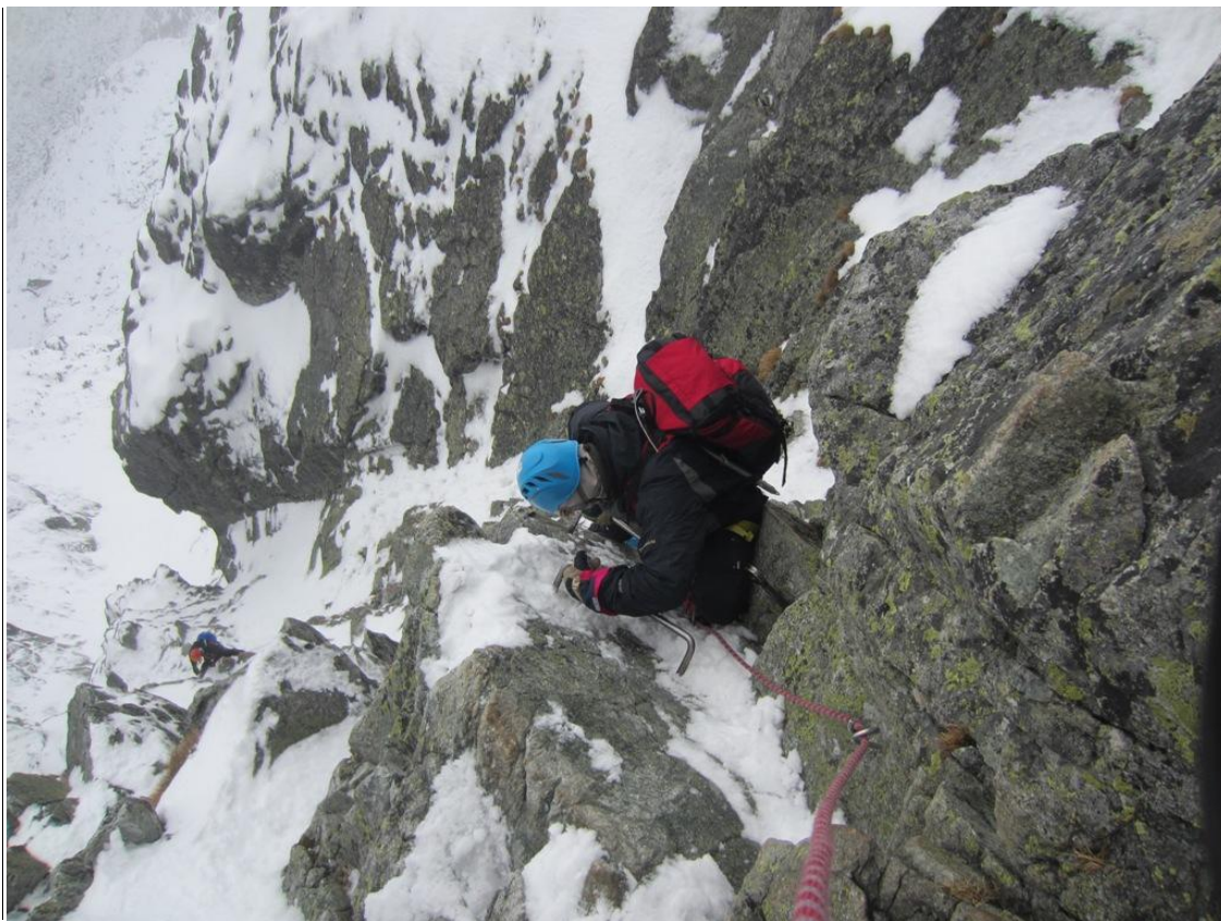
Antra uolų pakopa Balizovska proba techniškai pati sudėtingiausia ( foto 9)