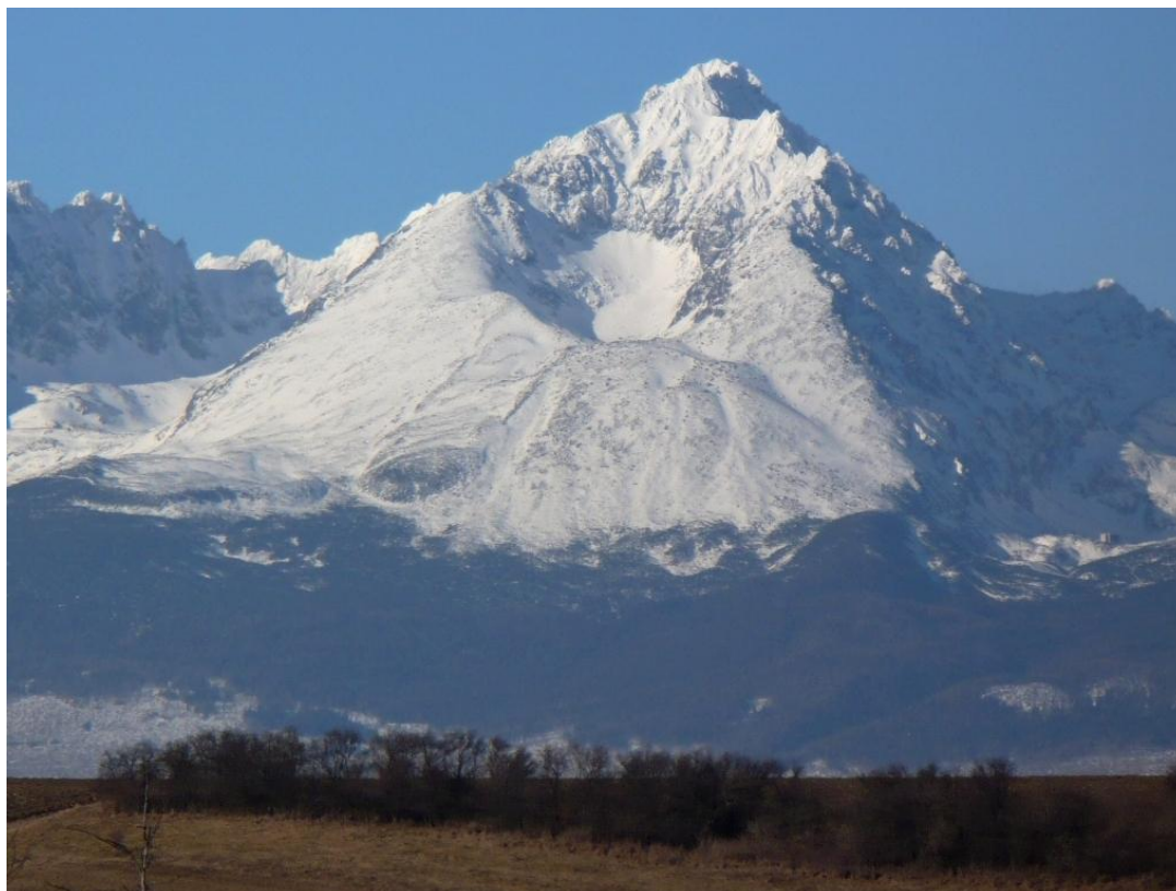
Gerlachovský štít 2655 m - aukščiausia Slovakijos, Aukštųjų Tatrų ir Karpatų viršūnė (foto 1).