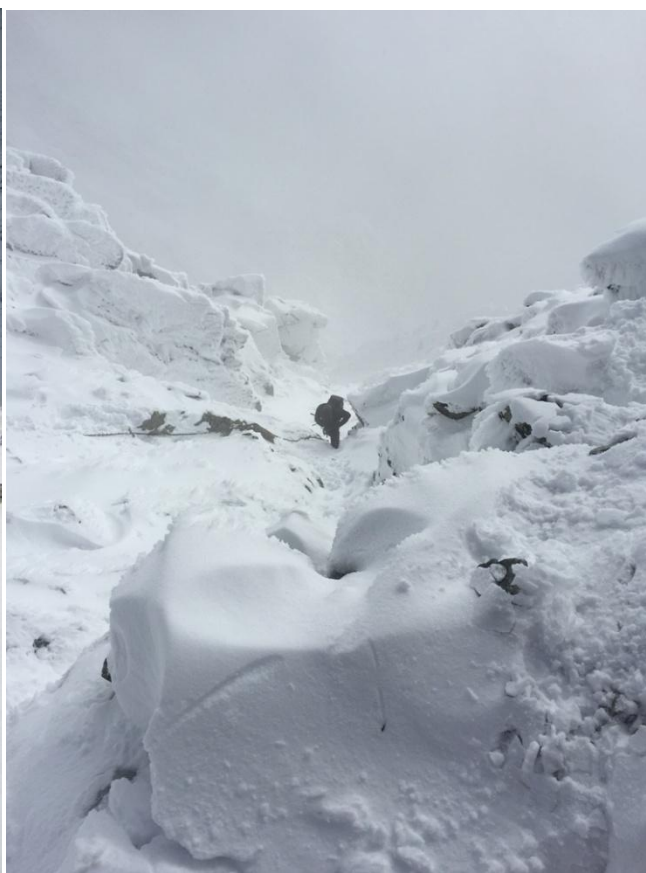
Labai status sniegu užpustytas kuliaras. Kopimas trim taktais. Pasitaiko apledėjusių uolų. Susikaupus daug sniego vietomis lavinų pavojus (foto 11-12).