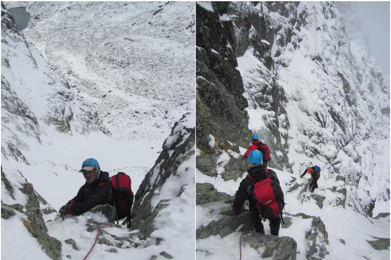
Pirma uolų pakopa ( apledėjusios uolos po sniegu). (foto 7-8)

Techniškai sudėtingų atkarpų nuotraukos Pateikti bent kelias nuotraukas!