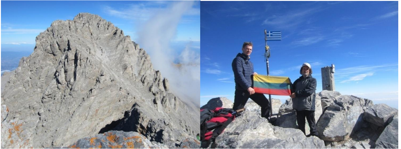
Olimpas ( Mitikas) 2919 m (Graikija) (foto 31-32 )