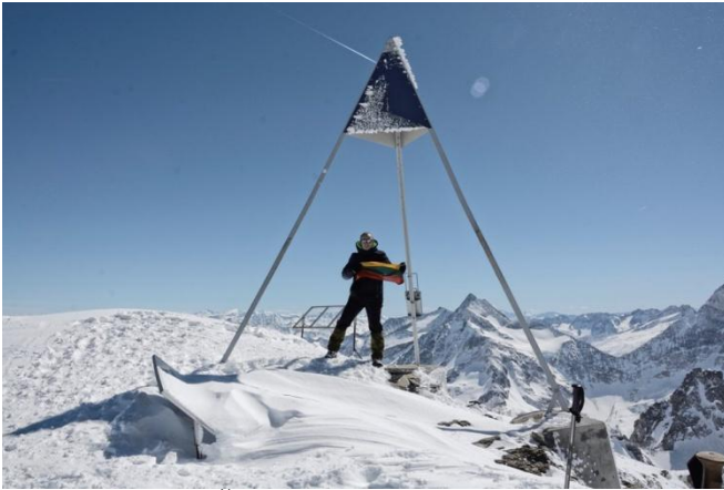
Titlis 3238 m. ( Šveicarijos Alpės)

Titlis 3238 m. ( Šveicarijos Alpės), Pico 2351 m (Azorų salos), Carrauntoohil 1038 m. (Airija), Ben Nevis 1344 m (Škotija), Rysy 2500 m (Lenkija), Triglavas 2864 m (Slovėnijos), Goverla 2061 m (Ukraina), Olimpas ( Mitikas) 2919 m (Graikija).