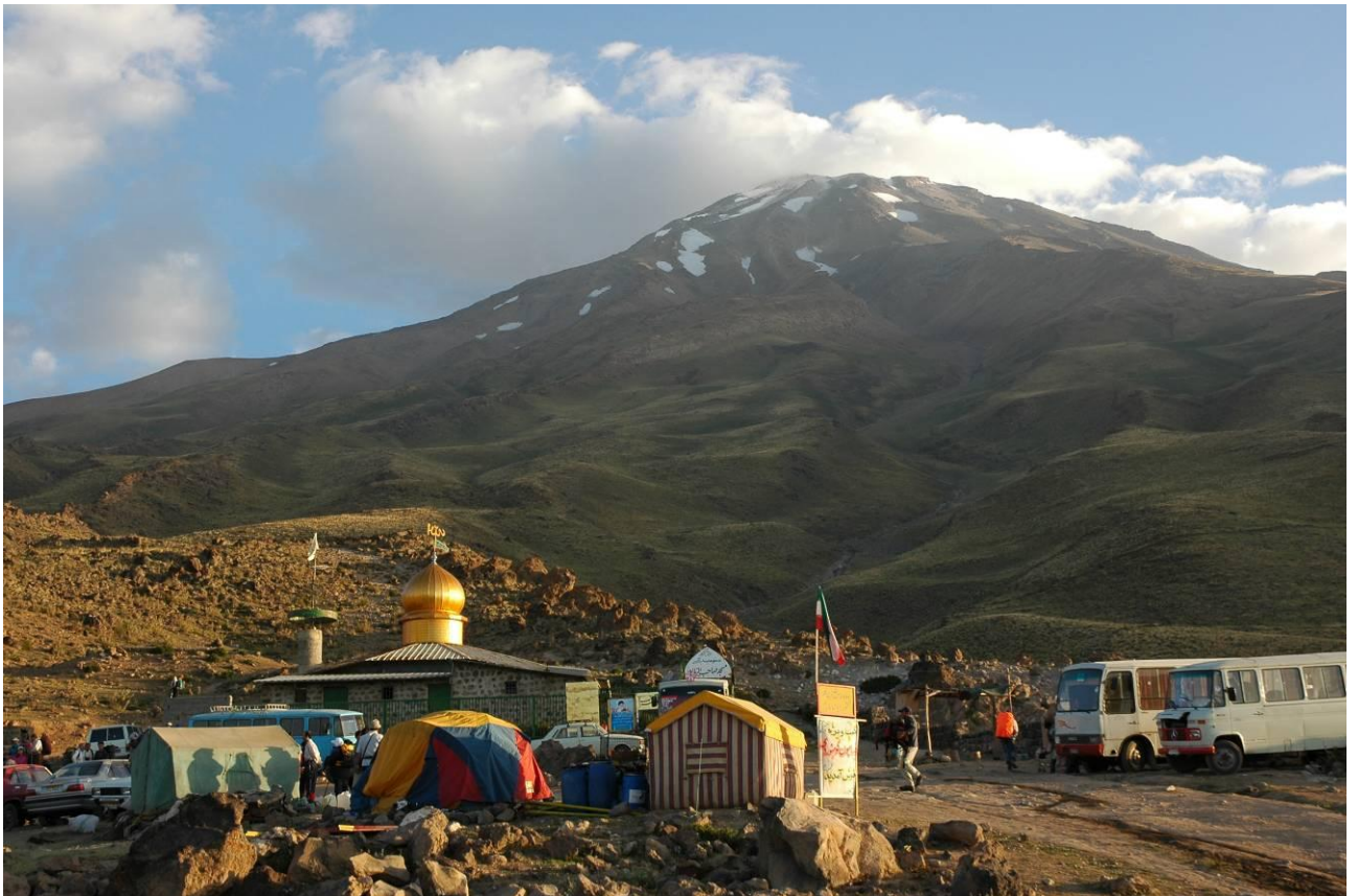
3 pav. Bazinė stovykla Goosfan Sara (2900 m)