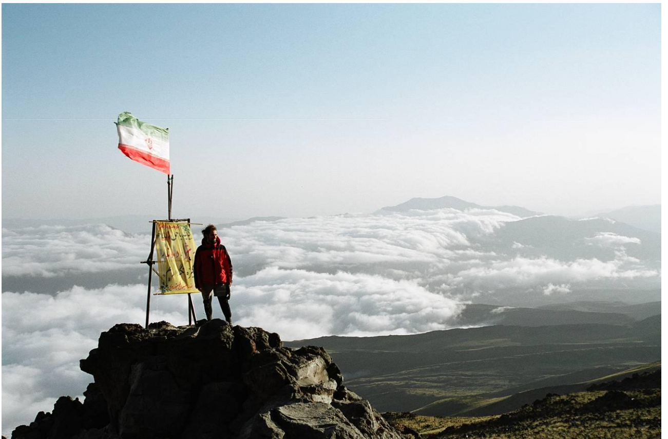
6 pav. Šturmo stovykloje Bargah-e-Sevo ant uolos iškelta Irano vėliava.