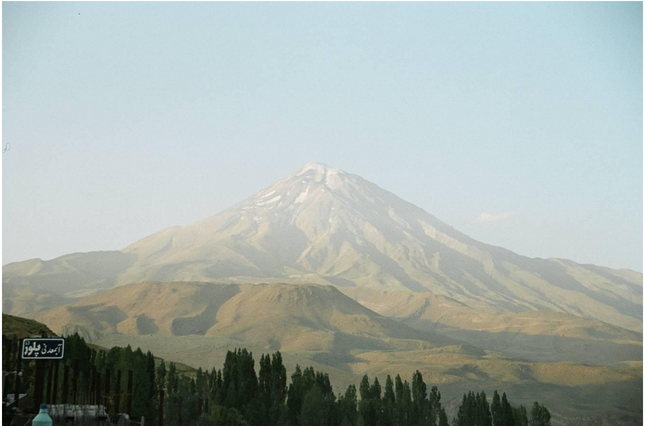
1 pav. DAMAVENDAS (5671 m/18601 ft) „Viduriniųjų Rytų stogas“, aukščiausias vulkanas Azijoje ir aukščiausias kalnas Irane.