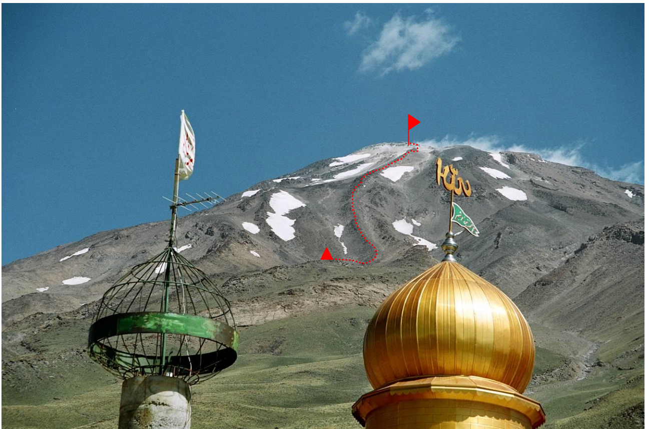
4 pav. Bazinės stovyklos Goosfan Sara akcentas nedidelė mečetė su auksiniu kupolu.