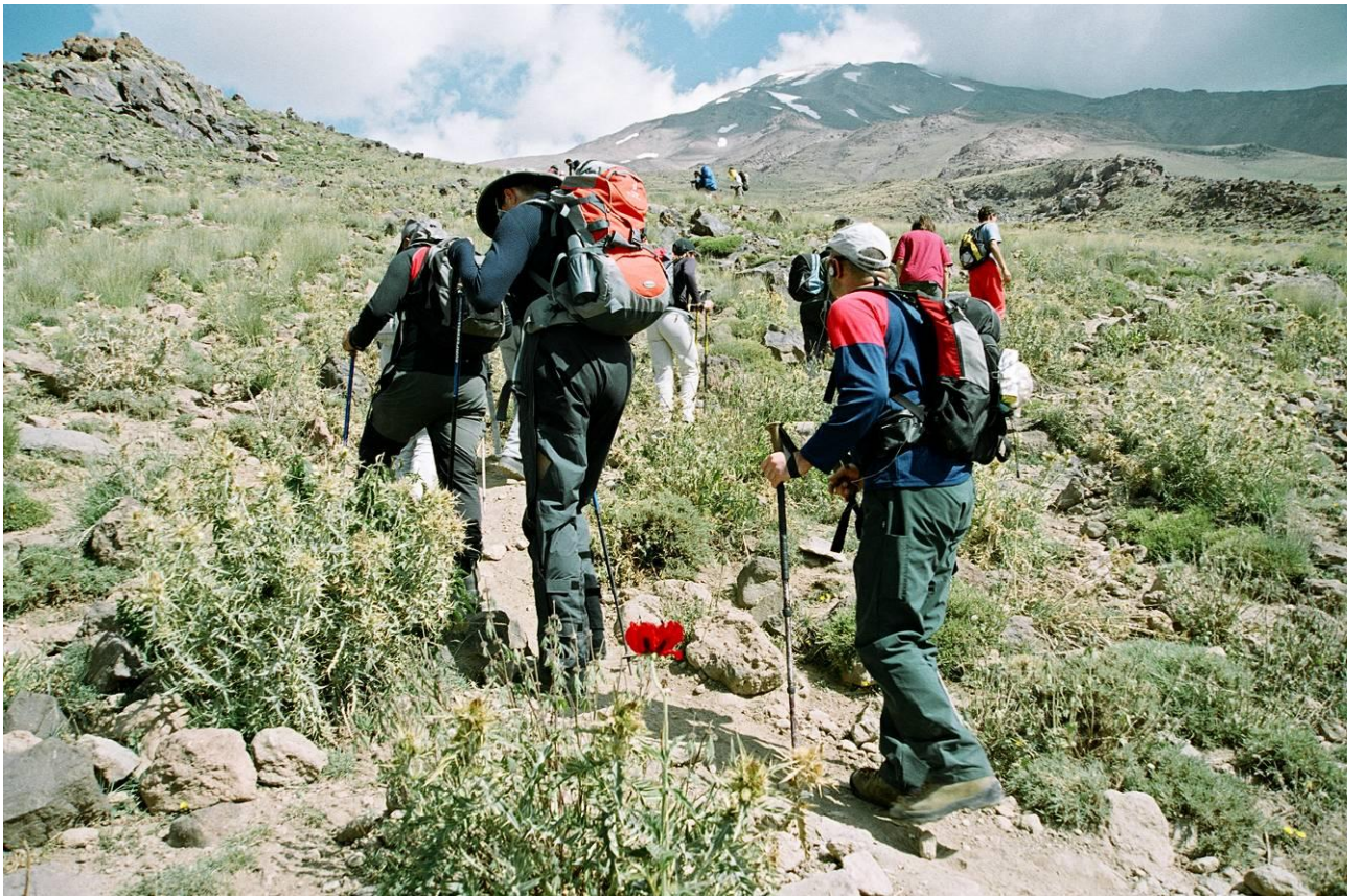
5 pav. Nuo Goosfan Sara iki Bargah-e-Sevon takas eina akmenuotu- žolėtu šlaitu.