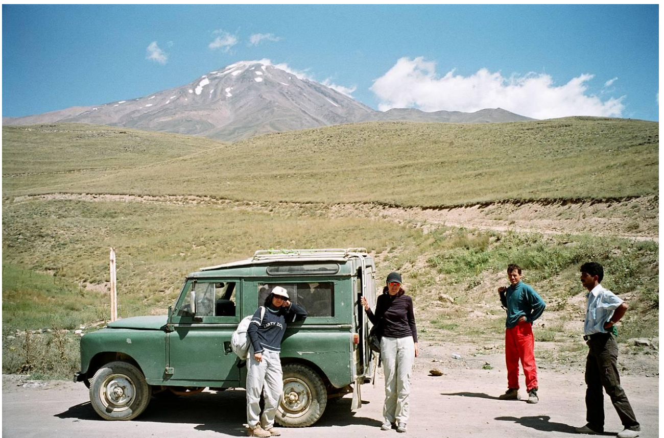
2 pav. Nuo kalnų centro viena valanda visureigiu iki bazinės stovyklos Goosfan Sara (2900 m)