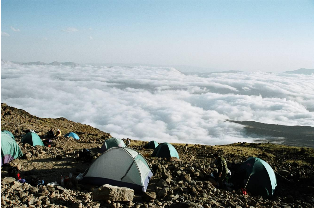
7 pav. Šturmo stovykloje yra paruošta keliasdešimt didelių ir mažų aikštelių palapinėms.