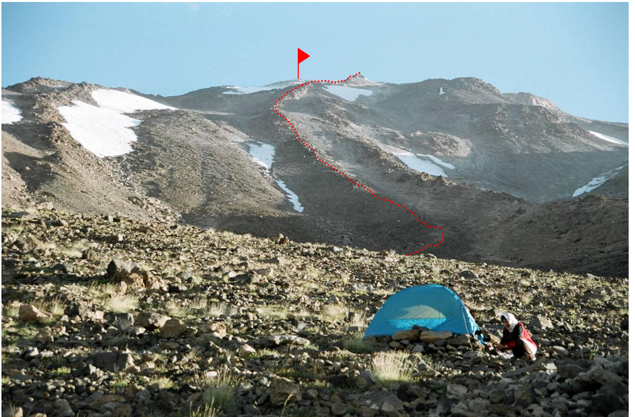
8 pav. Nuo stovyklos gerai matyti kelias į viršūnę iki „netikrosios viršūnės“.